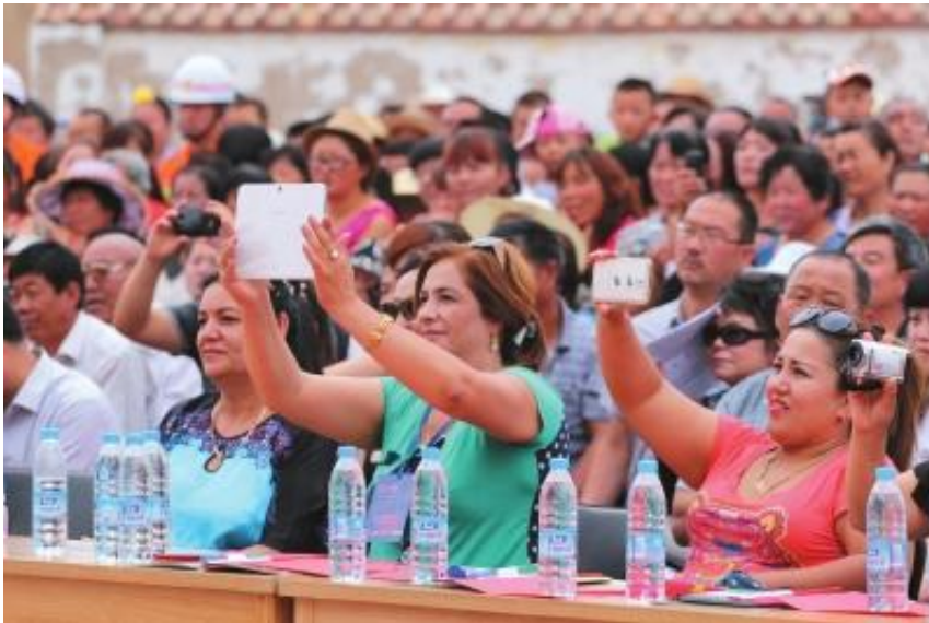
中外观众共赏墟落舞台

原题目：我省出台“十三五”时期文化扶贫事情实行方案 到2020年实现“墟落舞台”全笼罩