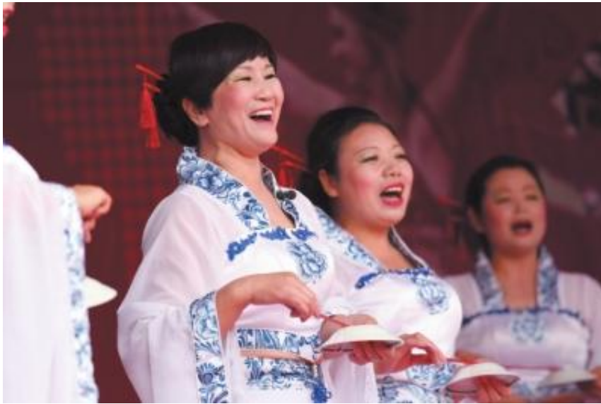
村民登上墟落舞台一展风范

克日，省文化厅印发“十三五”时期文化扶贫事情实行方案，不仅就“十三五”时期我省文化精准扶贫、精准脱贫事情作出了周全的摆设部署，并明确指出到2020年，要实现全省贫困地区州里综合文化站所有到达三级以上尺度、“墟落舞台”实现行政村全笼罩等五大详细指标。